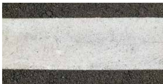
▲ 施工から2年経過した 3Lコート (拡大)