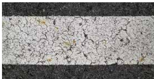
▲ 施工から2年経過した白線用塗料(ローラー塗り)(拡大)