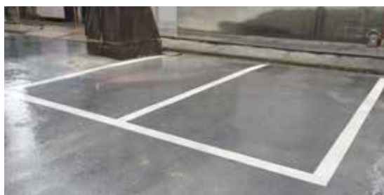
▲ 施工から2年後の白線