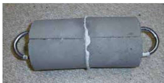
▲ コンクリート面をくっ付けるほどの密着力